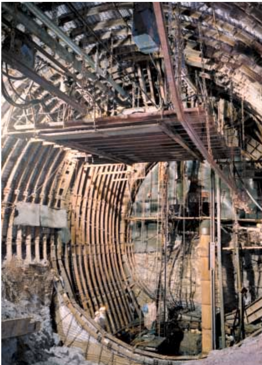
Schachtglocke auf der 6. Sohle