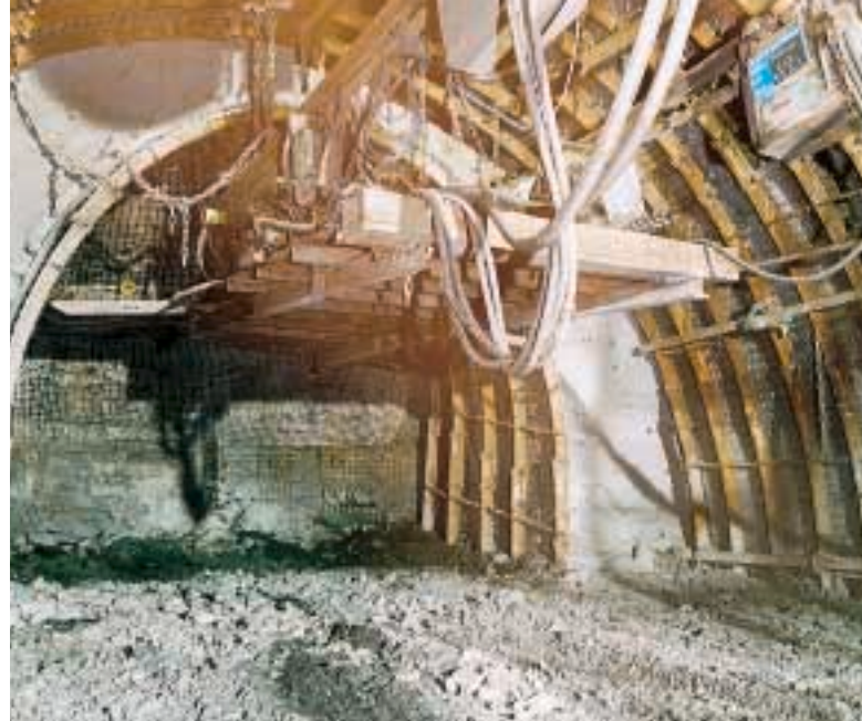
Querschnittsreduzierung aus dem südlichen Umtrieb zum Schacht 8

Da die letzten Bauhöhen im Niveau der 5. Sohle im Jahre 2003 abgebaut sein werden, muss die fördertechnische Versorgung der Anschlussbaufelder auf der 6. Sohle planmäßig Anfang 2003 durch die Anbindung des Schachtes an diese erfolgen. Eine wesentliche Aufgabe zur Realisierung ist das Erstellen der Schachtglocke, der Anschlussbauwerke zum nördlichen