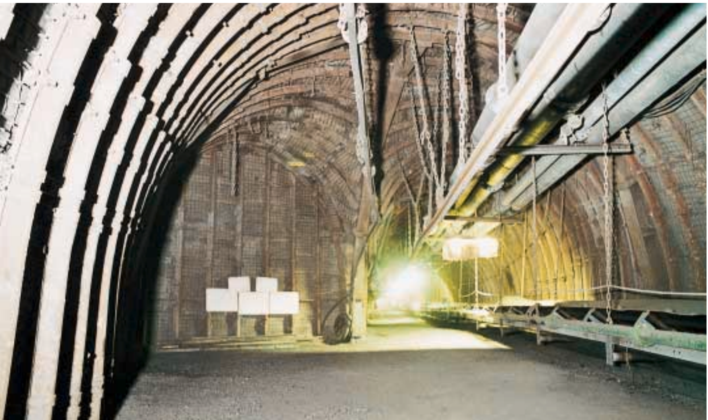
Brückenfeld, Ausgangspunkt der Streckenauffahrung zum Schacht 8

Der Streckenquerschnitt reduzierte sich von 48 m 2 aus dem Abzweig heraus auf den fünfteiligen BnC-Ausbau mit einem solchen von 26,9 m 2 bei einem Bauabstand von 0,60 m sowie 0,40 m Baustoffhinterfüllung. Die Auffahrung wurde bis auf einen Abstand von 38,50 m zur Schachtmitte herangeführt