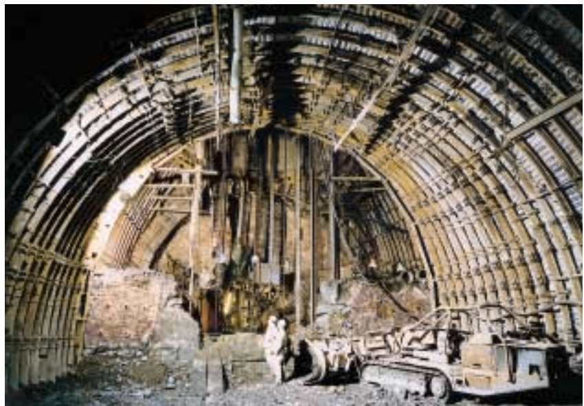
Fertiggestellter Querschnitt im Schachtbereich

Nach Abschluss der Arbeiten im Bauabschnitt 3 mit einer Annäherung von ca. 8,0 m an den Schacht wurde aus sicherheitstechnischen Gründen der Ausbau auf BnC 21,0 m 2 reduziert und als Rampe mit 16 gon Ansteigen gefahren. Der Durchschlag zum Schacht erfolgte dann mittels einer 3,0 m langen Türstockauffahrung bei einem Ausbruchsquerschnitt von 1,5 m 2 . Da zum Zeitpunkt des Durchschlages die Arbeiten im Schacht, wie beispielsweise das Fertigstellen der Schachtsicherungsüh-