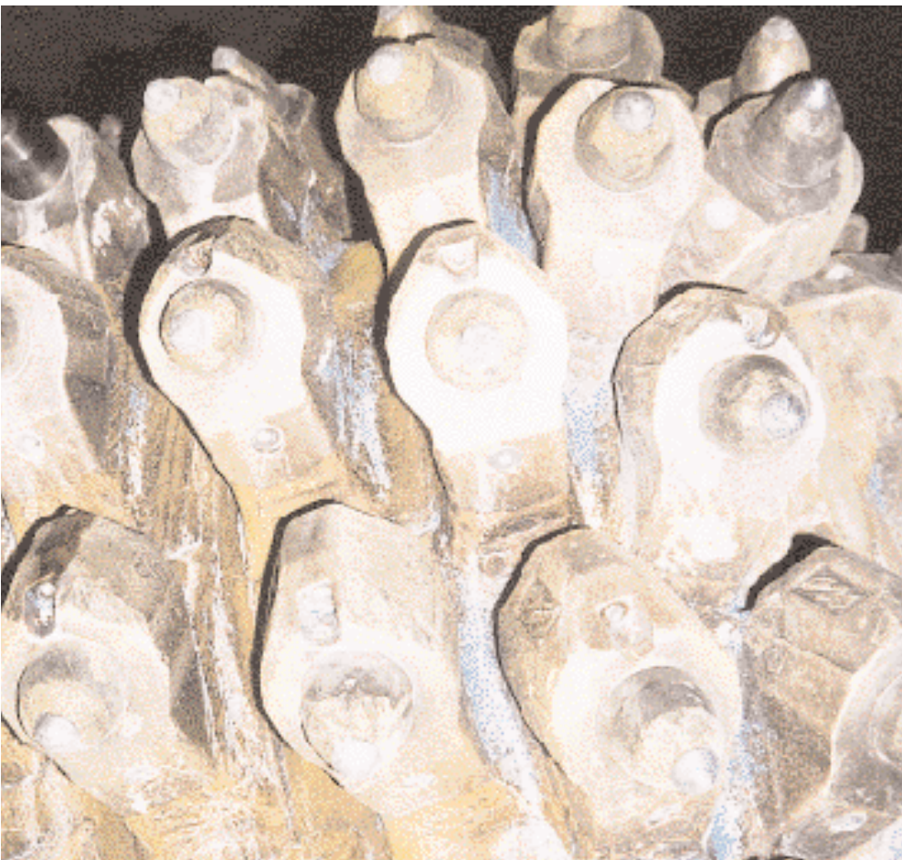
Neue Meißel – neue Meißelhalter – neues Schneidkopfdesign, abgestimmt auf spezifische Gesteinseigenschaften

stattet. Hiermit konnten sowohl die Leistungs-, Druck- und Bewegungs- als auch Schwingungsparameter gemessen werden, um das Standardsystem mit dem neu entwickelten ICACUTROC-System vergleichen zu können. Dazu wurde die AM 105 während der Testphase auf das Standardsystem umgebaut.