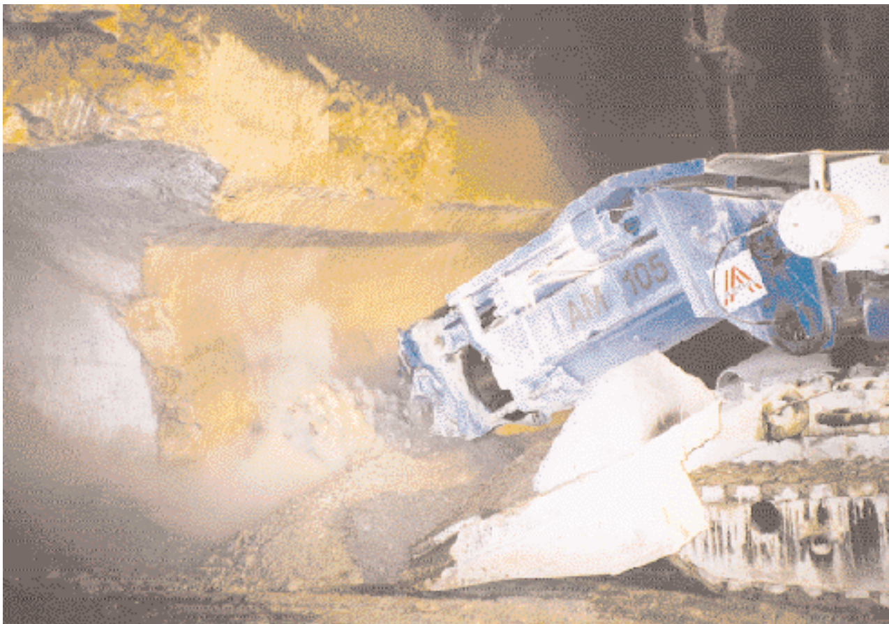
Testeinsatz im kompakten Kalkgestein mit ca. 200 MPA einaxialer Druckfestigkeit im Pozanotunnel in Süditalien